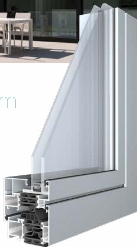
RECTO 80 met Fino-vleugel