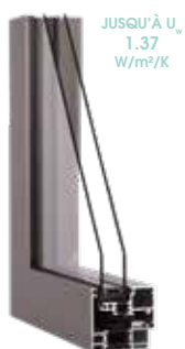
DRITTO Inviso 70 mm

Profel a fait de son mieux pour fournir correctement les informations dans cette brochure. Aucun droit ne peut toutefois être attribué aux informations et aux images reprises dans celle-ci. Profel ne peut en aucun cas être tenu pour responsable d'éventuelles erreurs.