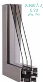
DRITTO Inviso 84 mm